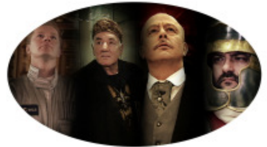
Schauspieler aus dem Standortfilm

sowie potentiellen Investoren. Er existiert als Vollversion in den Sprachen Deutsch und Englisch. Nach der Premiere am 25.02. kann der Film kostenfrei angefordert unter willkommen@region-A3.com .