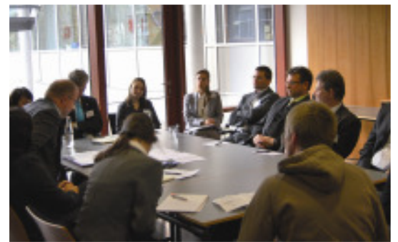
In kleinen Arbeitsgruppen diskutierten die Teilnehmer der Chankonferenz die Themenfelder und formulierten Lösungsansätze.

GmbH zu vernetzen. Die Teilnehmer des Workshops waren sich einig, dass sowohl für die Unternehmen in der Region wie auch für professionelle Personalakquisiteure bislang kein geeignetes Marketingmaterial vorliegt. Auch hier wurde die Regio Augsburg Wirtschaft GmbH als geeigneter Träger für die Entwicklung solcher Materialien be-