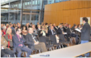
Teilnehmer der Chankonferenz 2009

Eine alternde Gesellschaft hat Auswirkungen auf das tägliche Leben, die wirtschaftliche Entwicklung und die Gestaltung der Region. Um diese Herausforderungen von morgen zu meistern, haben sich die Regio Augsburg Wirtschaft GmbH, die Stadt Augsburg, die AIP Augsburg und die Wirtschaftsuniönen Augsburg dem Thema „Wirtschaftliche Perspektiven durch den demografischen Wandel“ auf der Chankonferenz 2009 angenommen. 120 Vertreter aus Unternehmen, Verbänden, Kommunen und Politik nahmen im November 2009 die Veranstaltung zum Anlass, sich in Vorträgen zu informieren und in insgesamt sieben Workshops zu diskutieren. Nach einer Einführung zum Thema demografischer Wandel und einen Überblick zur Wohnungsmarktentwicklung und der Familienpolitik konnten die Teilnehmer dann in sieben Workshops die Diskussion vertiefen. Zur Auswahl standen u.a. Gesundheitsmanagement, Lebenslanges Lernen und Wohnungsmarktanforderung der Zukunft. Interessierte finden die Ergebnisse unter www.region-A3.com/chankonferenz_2009.html .