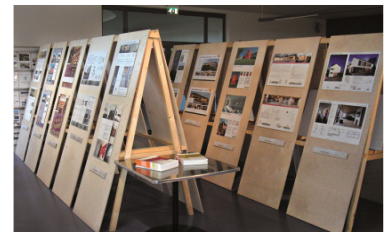
Spektakuläre Holzbauarchitektur wurde in der Hochschule Augsburg den über 40 Teilnehmern präsentiert