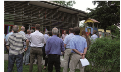
Busexkursion zu Kindergärten und Schulen aus Holz in der Region

Die Ausstellung zum Wettbewerb „Deutscher Holzbaupreis 2009“ tourt nun schon fast ein Jahr durch deutsche Städte und machte im Oktober für einen Monat Halt in Augsburg. Um die herausragende Holzbauarchitektur und die Möglichkeiten bei der energetischen Sanierung mit Holz einem breiten Publikum präsentieren zu können, war die Veranstaltung an drei Ausstellungsorten, HWK Schwaben, Hochschule Augsburg und Augsburger Passivhauszentrum zu sehen. An zwei Themenabenden wurden spektakuläre Beispiele der Holzbauarchitektur und die energetischen Aspekte beim Bauen mit Holz beleuchtet.