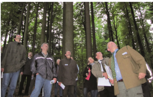
Expedition im Wald: 60 Teilnehmer informierten sich über die Wertschöpfungskette des „Grünen Goldes“.

Ende Juli wurden gleich drei Gebäude in der Region besucht, die mit Holz gebaut, erweitert und modernisiert wurden. 32 Architekten, Bauleiter und Politiker der Region nahmen an der Busexkursion zu Best-Practice-Beispielen