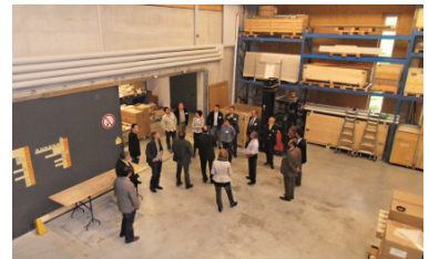
Gewerbebau aus Holz: das Netzwerk Holzbau zu Gast beim Pelletsheizungsbauer ÖkoFEN